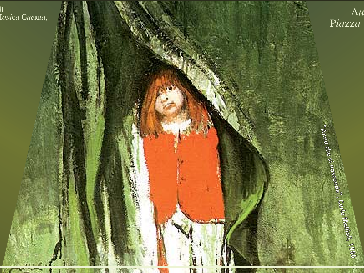
"Anna che si nasconde", Carlo Mattioli, 1986

Aula Magna, Ed. U6 Piazza dell'Ateneo Nuovo 20126 Milano